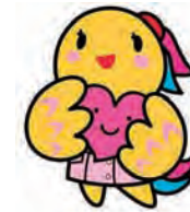
兵庫県立病院看護師マスコット あいタン