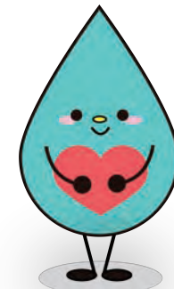
マスコットキャラクター しずくちゃん